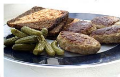
フリカデラ 香辛料のきいた 小ぶりのハンバーグ

豚肉の生産が知られ、豚肉のかたまりを皮がパリパリになるように火表いたフレスクスタイはデンマークの代表的な家庭料理として知られるハンバーグのフリカデラなどがある。また、バターやチーズなどの乳製品が豊富で、クリーム煮など乳製品を使った料理もたくさんみられる。