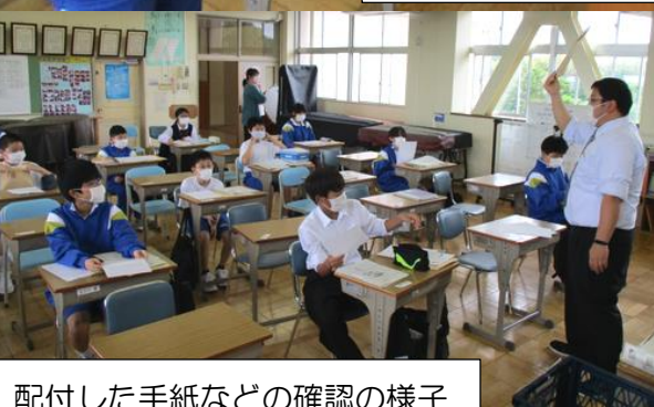
配付した手紙などの確認の様子