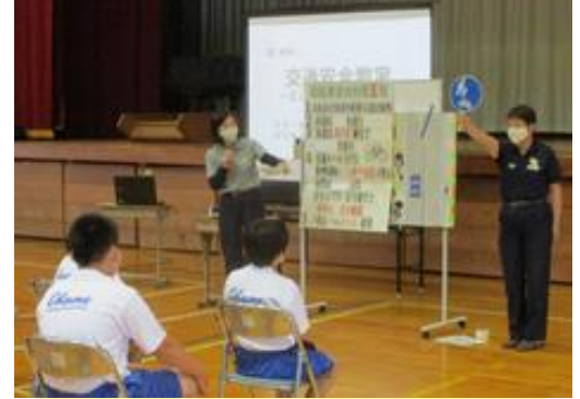
自転車安全利用五則や標識を確認