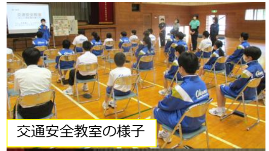
交通安全教室の様子