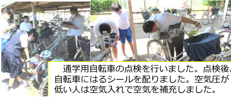
通学用自転車の点検を行いました。点検後、自転車にはるシールを配りました。空気圧が低い人は空気入れで空気を補充しました。

先月、牛久市地域安全課から4名の講師を招き「正しい自転車の乗り方」というテーマで交通安全教室を行いました。講師の先生方のほとんどは小学校にも来ていた方々なので、生徒たちには親しみやすく笑顔で迎えていました。今回は生徒の司会進行で行い、「自転車安全利用五則」やDVDで映像による事例を学習しました。次の日の振り返りには「今回学んだことに気をつけて登下校したい」や「自転車の危険性を改めてわかった」など自分の生活につなげていこうという思いが書いてありました。登下校などご家庭でも確認していただければと思います。