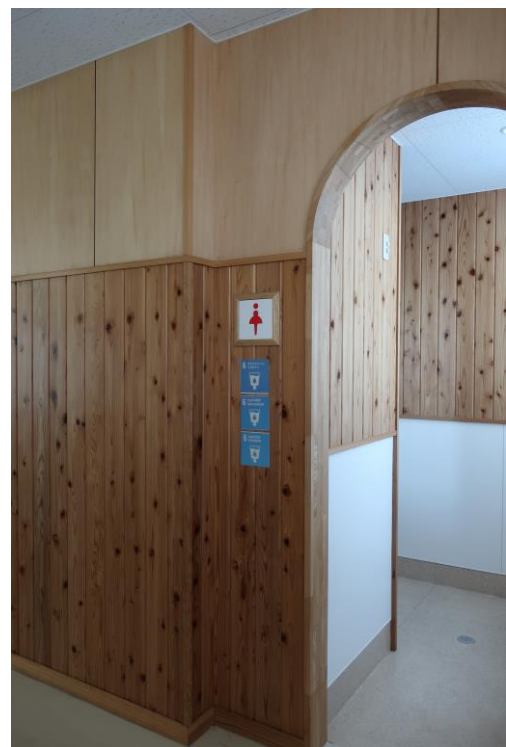
↑天然の木材を使った気持ちの良い トイレ。平成29年11月に改修工事 されたばかりです。