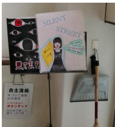
↑各階の階段の踊り場にあった→ 自主清掃道具。どの階の廊下・ 階段もとても綺麗でした。