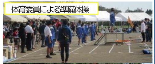
体育委員による準備体操

10月8日(日)におくの義務教育学校となって初めての奥野地区市民体育祭が行われました。コロナ禍で3年間、市民体育祭はありませんでしたが、4年目の今年、義務教育学校としては初参加でした。年度当初と日程が変更となり、学校登校日となったことや、早めの登下校、当日の持ちものなど、さまざまな点でご協力をいただき、ありがとうございました。久しぶりの奥野地区市民体育祭であり、運営側も子ども達も分からないことがありましたが、みんなでがんばろう、みんなで楽しもうという気持ちで、地域の人たちと共に地区の体育祭を作り上げることができました。地区の企業様からの景品の寄付がたくさんあり、子ども達も参加賞や入賞の景品を頂くことができ、喜ぶ姿が見られました。