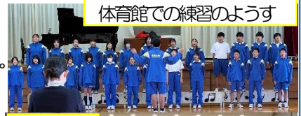
体育館での練習の様子

11月25日(土)に牛久市生涯学習センターで文化祭が行われました。保護者の皆様には、お弁当の準備や送迎など、お世話になりました。子ども達は、生涯学習センター大ホールの大きなステージに立ち、広い観客席にいる児童・生徒、保護者に向かって、クラスの歌声を届けることができました。7年生は男子と女子の人数に約3倍という大きな差がありました。その中でも、友達のいいところや改善するところを伝え合い、練習をがんばってきました。朝の練習では、早く登校した人たちが早めに練習場所の鍵やCDの準備をすることで、早めに練習をスタートすることができました。また、練習場所に数人でも集まったら練習を開始する様子も見られました。クラスのためにという思いを持って自ら考えて動くことができる姿が見られ、うれしく感じました。これからも自ら考えて行動し、よい思い出をつくってほしいと思います。